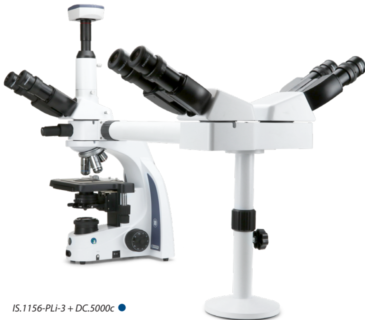
IS.1156-PLi-3 + DC.5000c ●